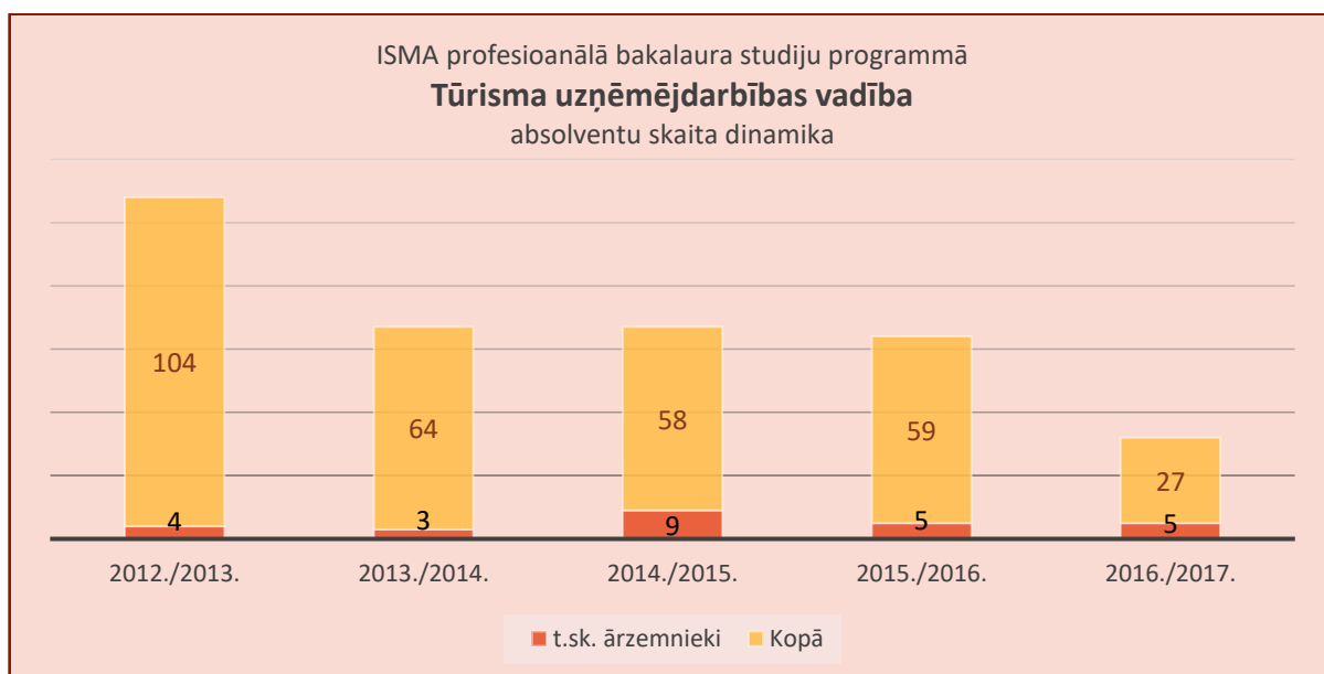
8.3. att. Absolventu skaits pārskata periodā no 2012./2013. līdz 2016./2017.

Kopumā, vērtējot studējošo skaita dinamiku pārskata periodā, var secināt, ka ISMA profesionālā bakalaura studiju programmai "Tūrisma uzņēmējdarbības vadība" ir perspektīvas, tā ir vēl vairāk jāattīsta un jāpilnveido, lai kļūtu vēl pievilcīgāka un saistošāka tieši studējošiem no ārzemēm.